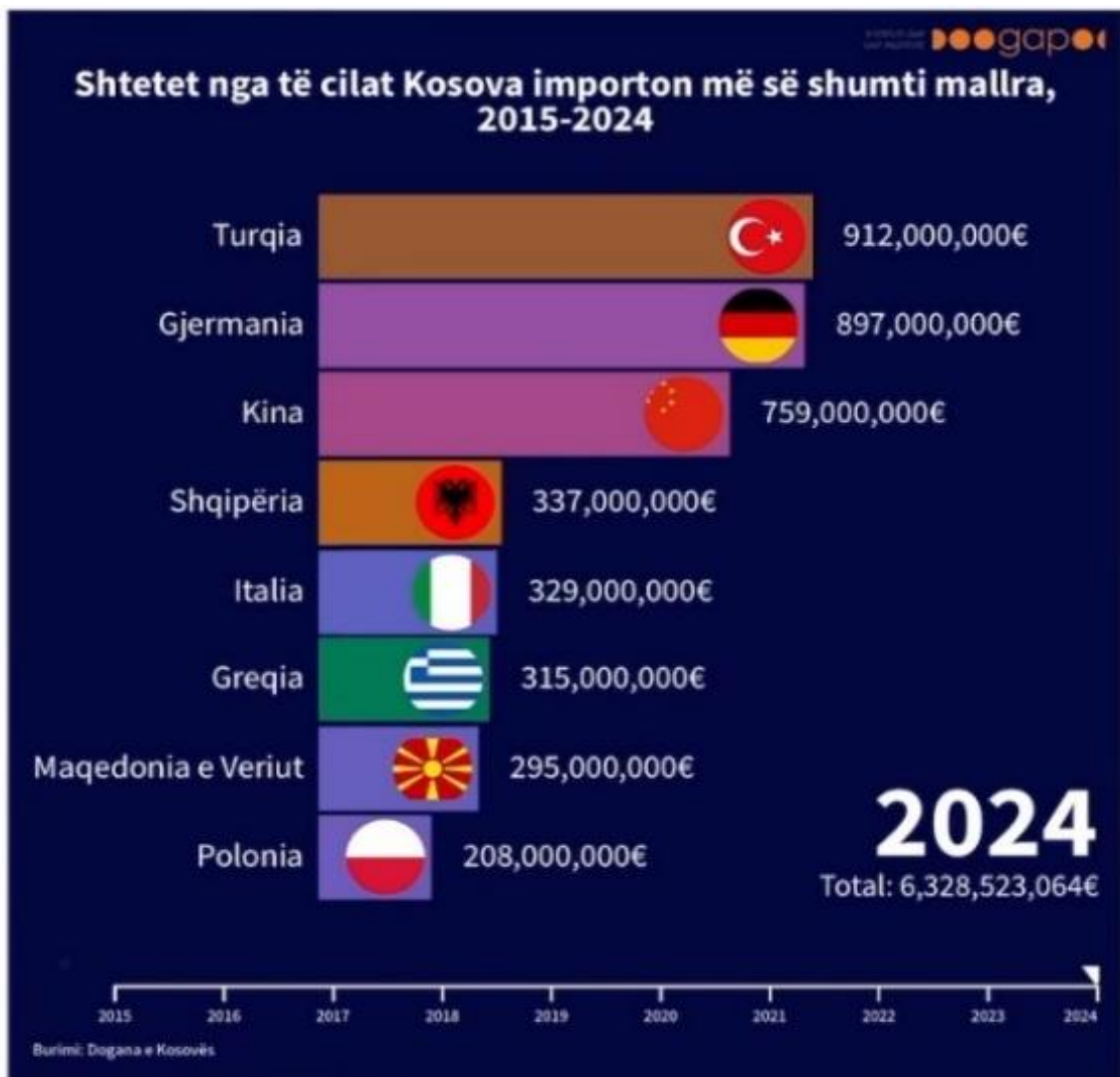
Figura 5. Top 10 vendet që Kosova ka exportu më së shumti në vitin 2024